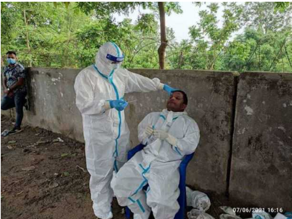
स्वास्थ्य कार्यालय उदयपुरबाट स्वाव संकलन गर्दै